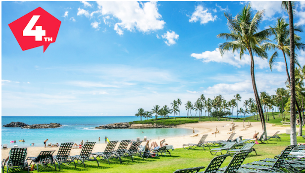
オリジナルバーチャル背景